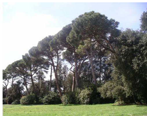
I grandi pini