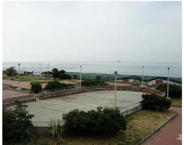
Il depuratore di Quinto allo stato attuale

Un nuovo impianto di illuminazione, sarà costituita prevalentemente da corpi illuminanti segnapasso posti a pochi cm dal suolo (30 cm), da corpi a basso assorbimento energetico con tecnologia LED, incassati nell'aiuola perimetrale, limitando solo a sei i pali di illuminazione, che verranno posti ai lati est ed ovest del depuratore. ♦