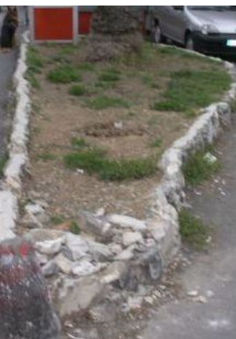
Prima e dopo

In questo periodo sono state adottate e riqualficate, grazie ai 20 commercianti associati al CIV Quinto al Mare, le seguenti aiuole.